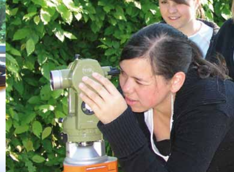
Angewandte Mathematik: Vermessungspraktikum Oberstufe