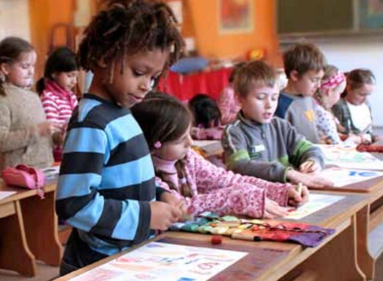
Arbeiten im „bewegten Klassenzimmer“ in der Unterstufe