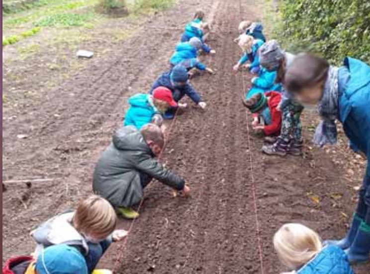
Gartenbauunterricht in der Unterstufe